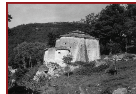
Castelgrande (PZ) - Chiesa di S.M. di Costantinopoli

Soprintendenza ai B.C.A. di Enna e Comune di Piazza Armerina