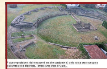
Fotocomposizione (dal terrazzo di un alto condominio) della vasta area occupata dall'anfiteatro di Epredea, Tantica Irea.