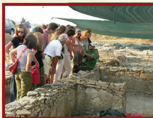
Archeologia Ritrovata a Soverato (CS)